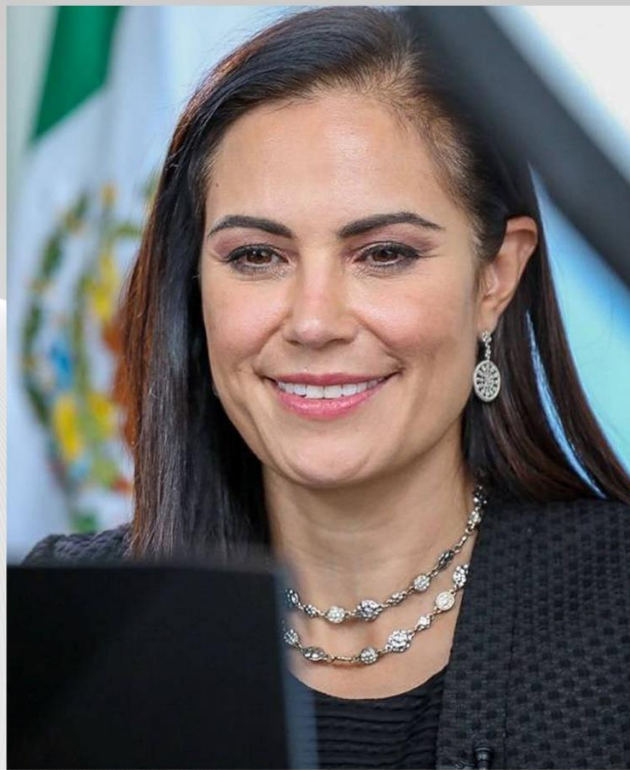
Alcaldesa de León, primera mujer presidenta de la ANAC

Hay muchas cosas por hacer, pero lo que realmente nos va ayudar a ser mejores es cuando trabajamos en equipo, cuando