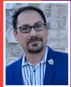
JOSÉ PALACIOS Presidente de Consejo de Cultura de Coahuila